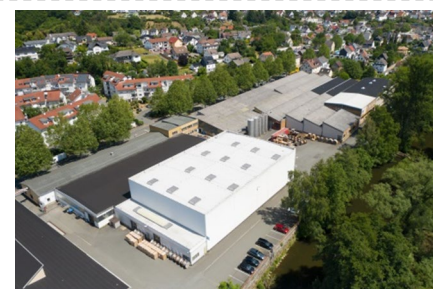
Unternehmenssitz in Asslar in Hessen