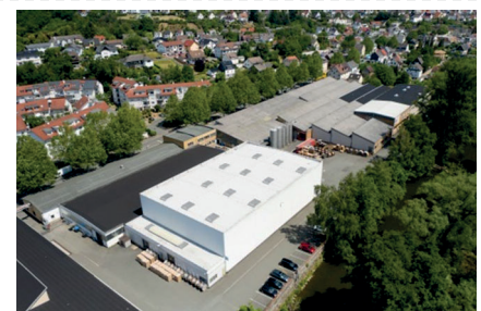
Unternehmenssitz in Asslar in Hessen

Unsere Kunden sind in den Bereichen Elektro- und Elektronikindustrie, Telekommunikationsnetze, Elektrofachgroßhandel, Automobilzulieferindustrie, Audio- und Studioteknik sowie Medizintechnik und Wissenschaft tätig.